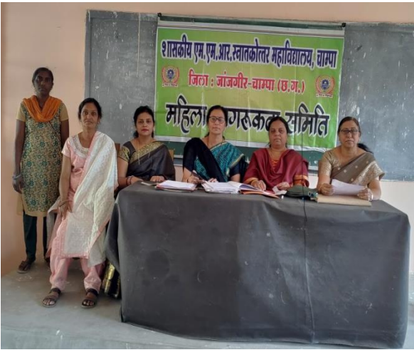
Women Awareness Cell