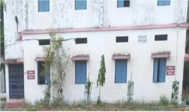
Girls Common Room