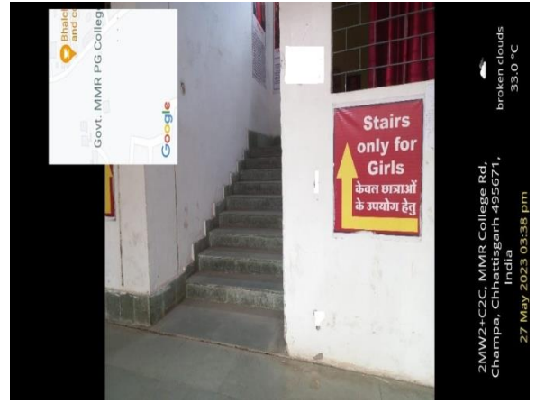
Stairs for Girls